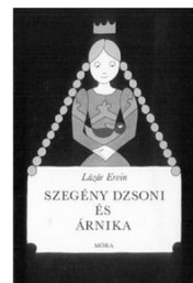
Szegegy Dzsóni és Árnika (1993)

Mivel 1959. február 1-jétől az Esti Pécsi Napló újságíróként alkalmazta, az egyetemen ugyanez év decemberében különbözeti vizsgát tett, és tanulmányait magyar szakon, levelező tagozaton folytatta. 1961-ben szerzett magyartanári diplomát.